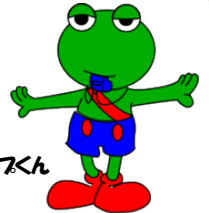
ストロップズくん

県民一人ひとりが交通安全について考え、交通ルールの遵守と交通マナーの実践を習慣付け、交通事故のない安全で快適な交通社会を実現しましょう。